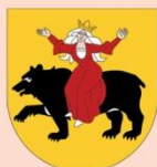
Prezydent Miasta Tomaszów Mazowiecki