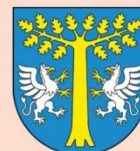
Wójt Gminy Dębica