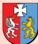
Marszałek Województwa Podkarpackiego