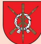
Wójt Gminy Moszczenica